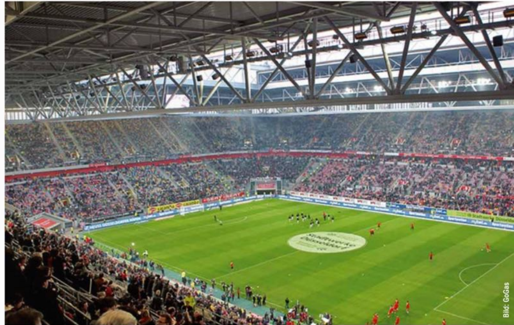
Eine Stadionheizung mit IR-Technik sorgt für Mehrwert und Umsatzplus beim Verzehr und Merchandising.

Die Wärme wird dort umgesetzt, wo sie benötigt wird – im Aufenthaltsbereich der Personen. Schon kurz nach dem Einschalten der Geräte wird ein deutliches Wärmeempfinden spürbar. Durch die sofortige Betriebsbereitschaft der Infrarotstrahlungsheizung werden der Energiebedarf und damit die Energiekosten