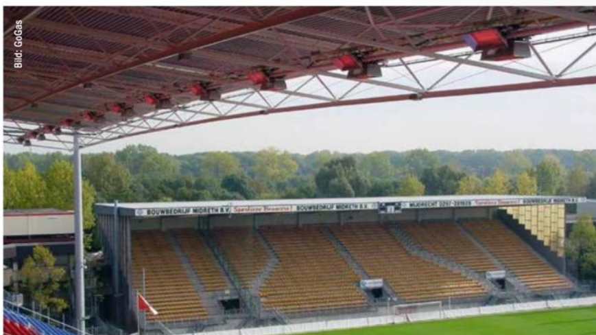
Infrarotstrahlung für besseren Komfort für Zuschauerinnen und Zuschauer.

Die Strahlungswirkungsgrade und die damit verbundene bessere Energieausnutzung werden verständlicherweise immer weiter erhöht. Diese Forschungs- Entwicklungsarbeit hat bis heute sehr effiziente Strahlersysteme hervorgebracht. Heute verfügen so genannte Kombistrahler über einen geschlossenen wärmeisolierten Reflektor. Der heizt sich auf eine Tempe-