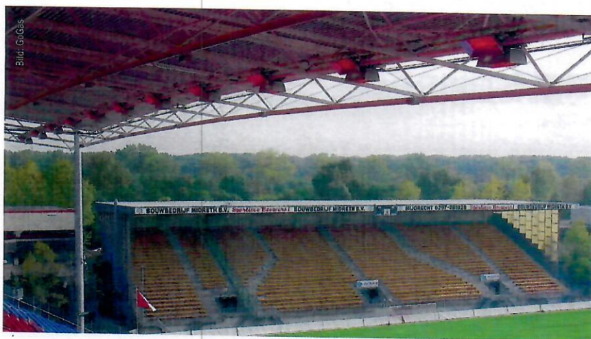
Infrarotstrahlung für besseren Komfort für Zuschauerinnen und Zuschauer.

Die Strahlungswirkungsgrade und die damit verbundene bessere Energieausnutzung werden verständlicherweise immer weiter erhöht. Diese Forschungs- Entwicklungsarbeit hat bis heute sehr effiziente Strahlersysteme hervorgebracht. Heute verfügen so genannte Kombistrahler über einen geschlossenen wärmeisolierten Reflektor. Der heizt sich auf eine Tempe-