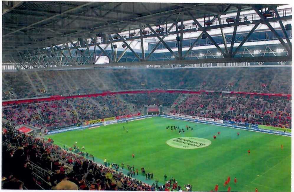
Eine Stadionheizung mit IR-Technik sorgt für Mehrwert und Umsatzplus beim Verzehr und Merchandising.

allgemein gültig ermitteln, da die Umschließungsflächen des Gebäudes nicht definiert sind. Aus diesem Grund wird bei der Projektierung von Tribünen und ähnlichen Freiflächen von einer Außentemperatur ausgegangen, die in Kombination mit einer gewissen Strahlungsintensität bekanntermaßen zu behaglichen Empfindungstemperaturen führt. Da die Zuschauer während der kalten Herbst- und